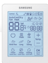
Kabelový Dotykový Ovladač