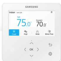
Kabelový Ovladač CZ/SK