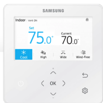
Kabelový Ovladač CZ/SK