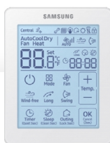
Kabelový Dotykový Ovladač