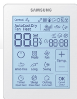
Kabelový Dotykový Ovladač